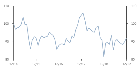
■ AT類 (美元) 累積股份