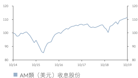
■ AM類 (美元) 收益股份