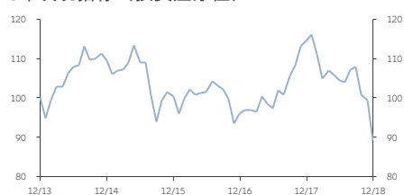
■ AT類 (美元) 累積股份